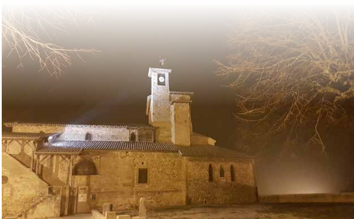
L'esplanade de l'église sous la neige (-10°) en février 2018

ou contactez-nous par tél. : 04 75 79 04 13 ou par mail : renov-habitat-durable@valenceromansagglo.fr