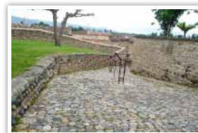
Calade de l'église imperméabilisée petit à petit