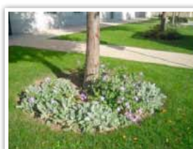
Des pieds d'arbre protégés des mauvaises herbes par un tapis de fleurs