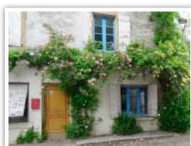
Une maison de village fleurie

Enfin, votre implication est nécessaire pour la réussite de cette opération. Nous vous demandons donc d'entretenir vos pieds de murs pour faciliter le travail des services techniques. Pour vous aider, des graines de fleurs sauvages sont distribuées avec le bulletin municipal ou sont disponibles en mairie.