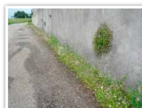
Plantation de graines pied de mur au cimetière