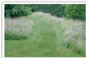
Chemin de promenade le long de la Barberolle avec simple passage